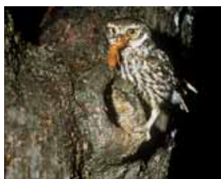
Chouette chevêche sur pommier.

Fragilisés par l'arboriculture spécialisée de basse-tige, nos vergers de plein vent vivent dans certains territoires de tradition fruitière. Ils sont encore présents dans des zones agricoles refuges où domine l'herbage, comme le piémont pyrénéen et les marges du Massif Central. Ce patrimoine fruitier aurait pu disparaître sans l'alerte donnée par des passionnés des variétés (Croqueurs de pommes...) dans les années 1970-80. Si les connaissances pomologiques avancent depuis, le verger traditionnel héberge une diversité variétale encore malconnue et menacée.